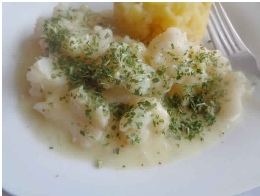
Sauce béchamel weight watchers

Notre site partenaire RECETTE 360 nous propose cette recette weight watchers sans le cookeo alors voilà comment je ferai avec le cookeo. Pour les ingrédients allez sur notre site partenaire puis revenez pour