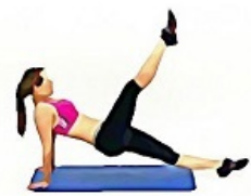
8. CISEAUX APPUI DORSAL