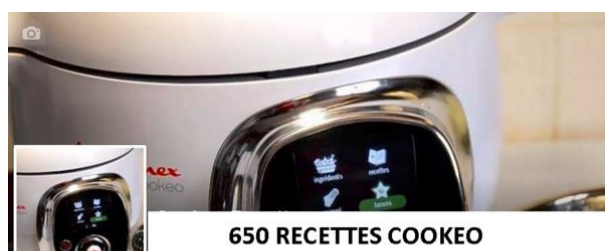
Volume 1 : ABCD |

Vous cliquez sur l'image du PDF que vous voulez télécharger puis vous arrivez sur le document google drive ,il vous suffit de le télécharger en cliquant sur la flèche (en haut du document)