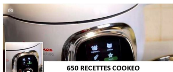
Volume 2 : EFGH |