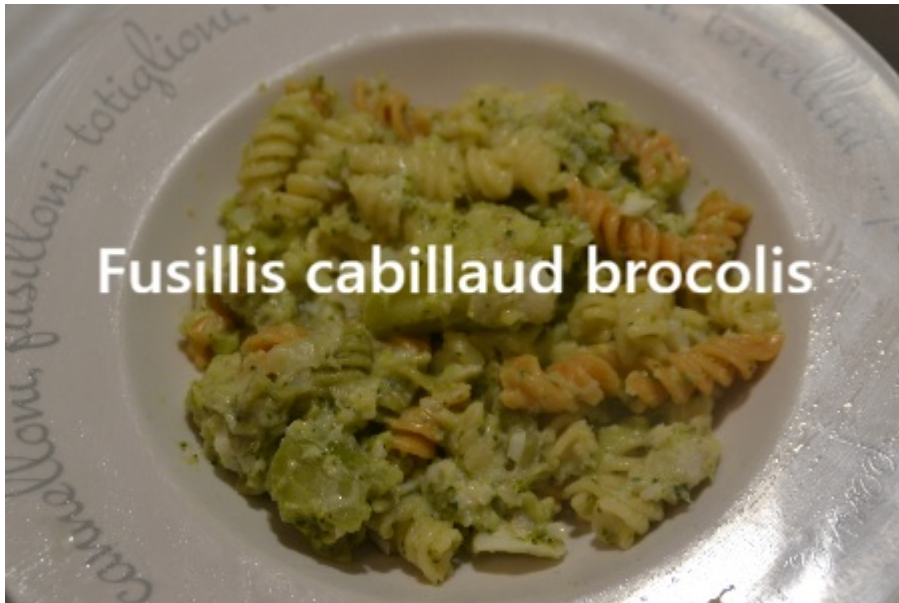
Fusillis cabillaud brocolis