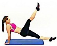
8. CISEAUX APPUI DORSAL