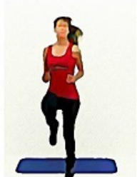
5. MONTEE GENOUX