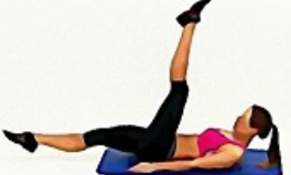
7. CISEAUX DOS