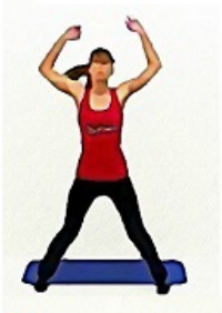
1. JUMPING JACK